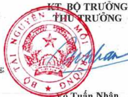
Võ Tuấn Nhân